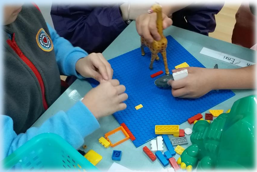
幼兒由不同的玩具開始組合 進行遊戲