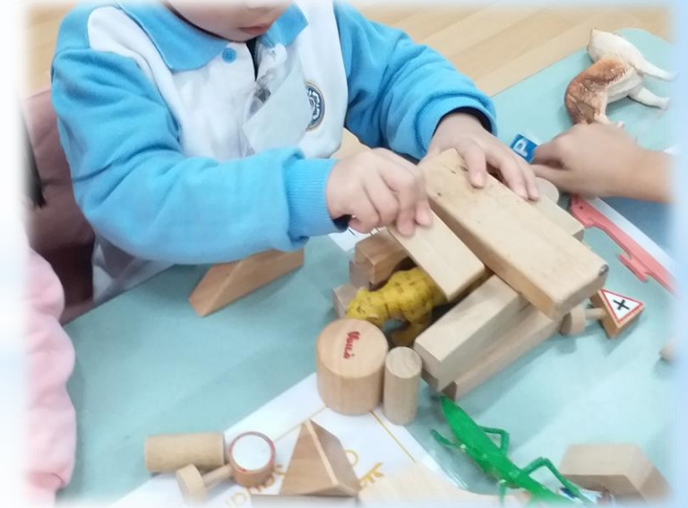
有些幼兒甚至興建動物園， 要將兇猛的動物分隔出來