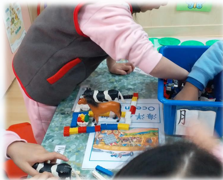
他們認為這些動物要受保護， 因此為它們興建房屋